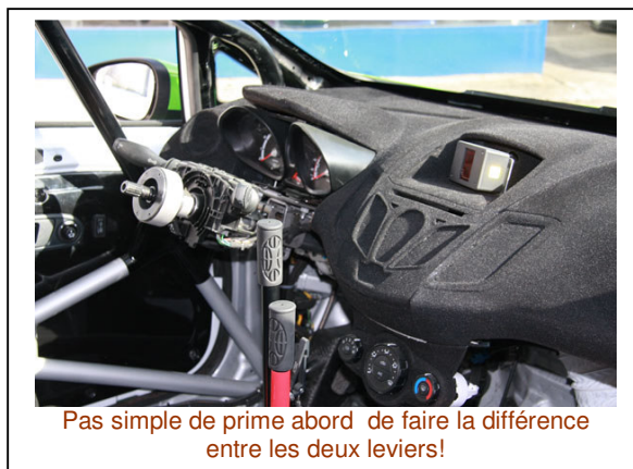
Pas simple de prime abord de faire la différence entre les deux leviers!

A peine quelques minutes d'attente et me voilà installé dans la Ford Fiesta R2. Comme dans toutes voitures modernes, la position est basse mais pas trop reculée. La colonne de direction a conservé sa longueur d'origine, c'est une R2, pas une Super 2000 ! Après un petit temps d'adaptation et un rétroviseur cassé, les dimensions précises de la monture sont cernées. La commande de boîte de vitesse et le frein à main sont disposés côte à côte. C'est l'un des petits points négatifs de cette construction intérieure. En effet, les deux leviers verticaux sont très proches l'un de l'autre et pour se saisir du frein à main il faut glisser sa main entre les deux commandes tubulaires. Quand on sait que cet outil est souvent une forme « d'assurance vie », il aurait été préférable d'avoir une commande de boîte placée différemment. En conclusion, même si l'on s'y habitue à l'usage, laisser un accès totalement dégagé pour le frein à main aurait été plus pertinent. Pour le reste, pédalier, siège, etc... tout est bien pensé et réalisé.