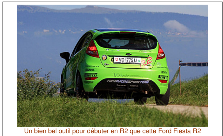
Un bien bel outil pour débuter en R2 que cette Ford Fiesta R2

En résumé la Ford Fiesta est une R2 développée dans l'esprit voulu par la FIA au moment de la création de ce nouveau groupe. Elle est idéale pour qui veut passer du groupe N à une vraie auto de course. Le jour où les chronos sont excellents avec la Fiesta R2, son utilisateur aura atteint un très bon niveau de pilotage et pourra monter dans n'importe quelle auto de catégorie supérieure en ayant la certitude qu'il réalisera « des temps ». Que demandez de plus d'une si sympathique auto ?