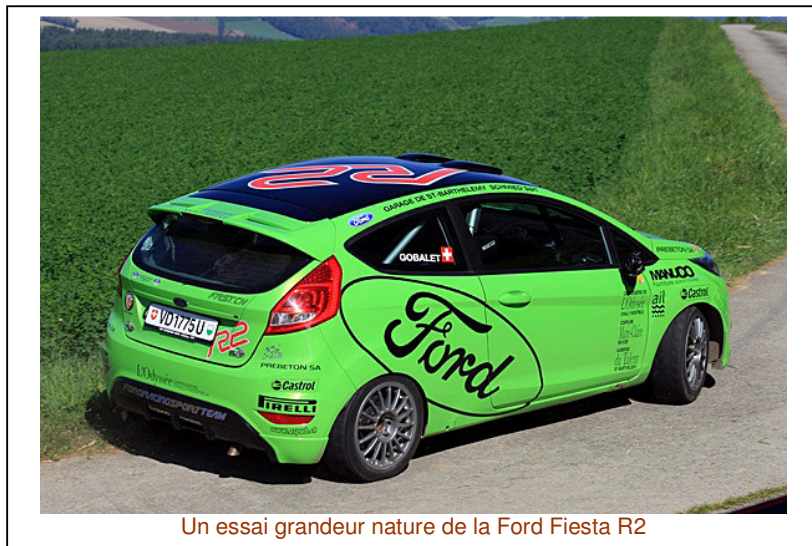
Un essai grandeur nature de la Ford Fiesta R2